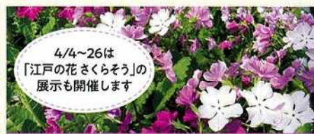
4/4~26は「江戸の花さくらそう」の展示も開催します