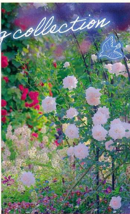
カラーリーフガーデン チューリップほか 見頃 4月 バラ 見頃 5月