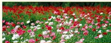
シャーレーポピー 数量 約30万本/見頃 5月下旬