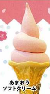
あまおうソフトクリーム