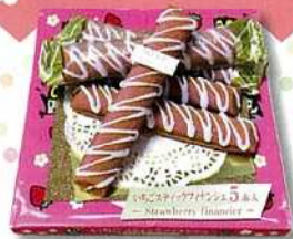
森林公園オリジナル いちごスティックフィナンシェ