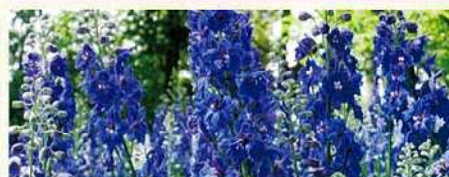
デルフィニウム 数量 約4,000株/見頃 5月上旬~下旬