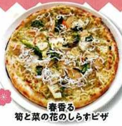
春香る 筍と菜の花のしらすピザ