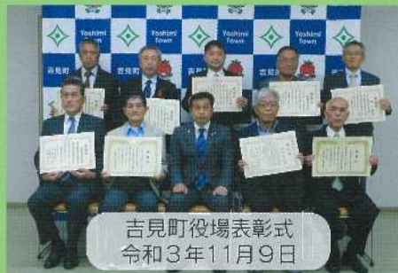
吉見町役場表彰式 令和3年11月9日