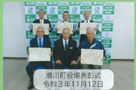
滑川町役場表彰式 令和3年11月12日