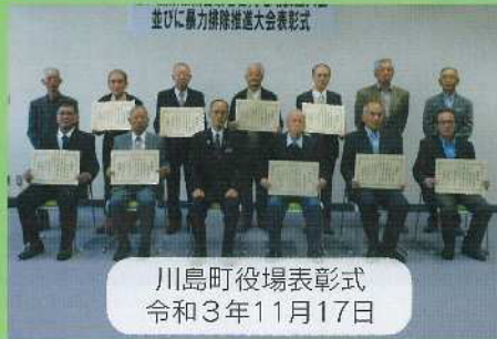
川島町役場表彰式 令和3年11月17日