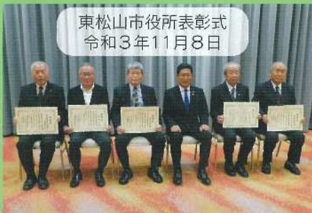
東松山市役所表彰式 令和3年11月8日

毎年秋に行っております地域安全大会・暴力排除推進大会が新型コロナウイルス感染拡大防止のため、昨年に引き続き中止となりました。例年、大会において日頃の防犯活動並びに暴力排除推進活動に積極的に取り組んでいただいている方々に感謝状を、防犯ポスター優秀者には賞状の授与を行っておりますが、今年も市役所、各役場、警察署、学校等に分散して表彰式を行いました。受賞者の皆さま、おめでとうございます。今のところ、感染者数は激減していますが、今後も引き続き感染拡大防止に気を付けながら出来る範囲での地域安全活動をお願いいたします。