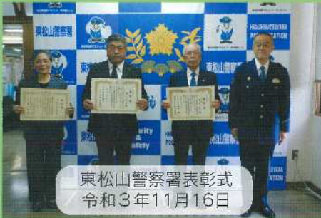
東松山警察署表彰式 令和3年11月16日