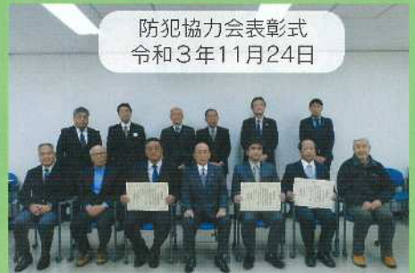
防犯協力会表彰式 令和3年11月24日