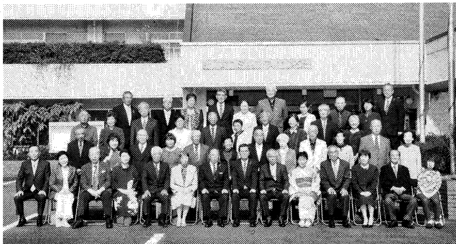
コミュニティセンターで「金婚式」のお祝いを実施しました。