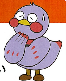
埼玉県マスコット 「ざいたまっち」