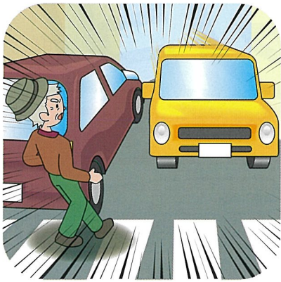
横断時は特に左方からの車に注意しましょう