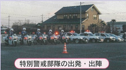
特別警戒部隊の出発・出陣