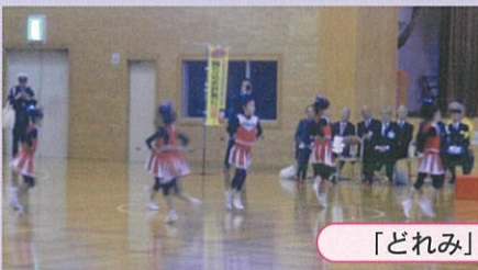
「どれみ」による演技