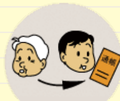
年金などを勝手に 使ってしまう