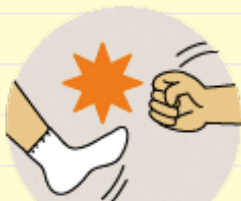
殴る蹴るなどの暴力