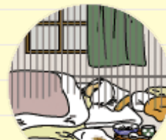
劣悪な環境で放置