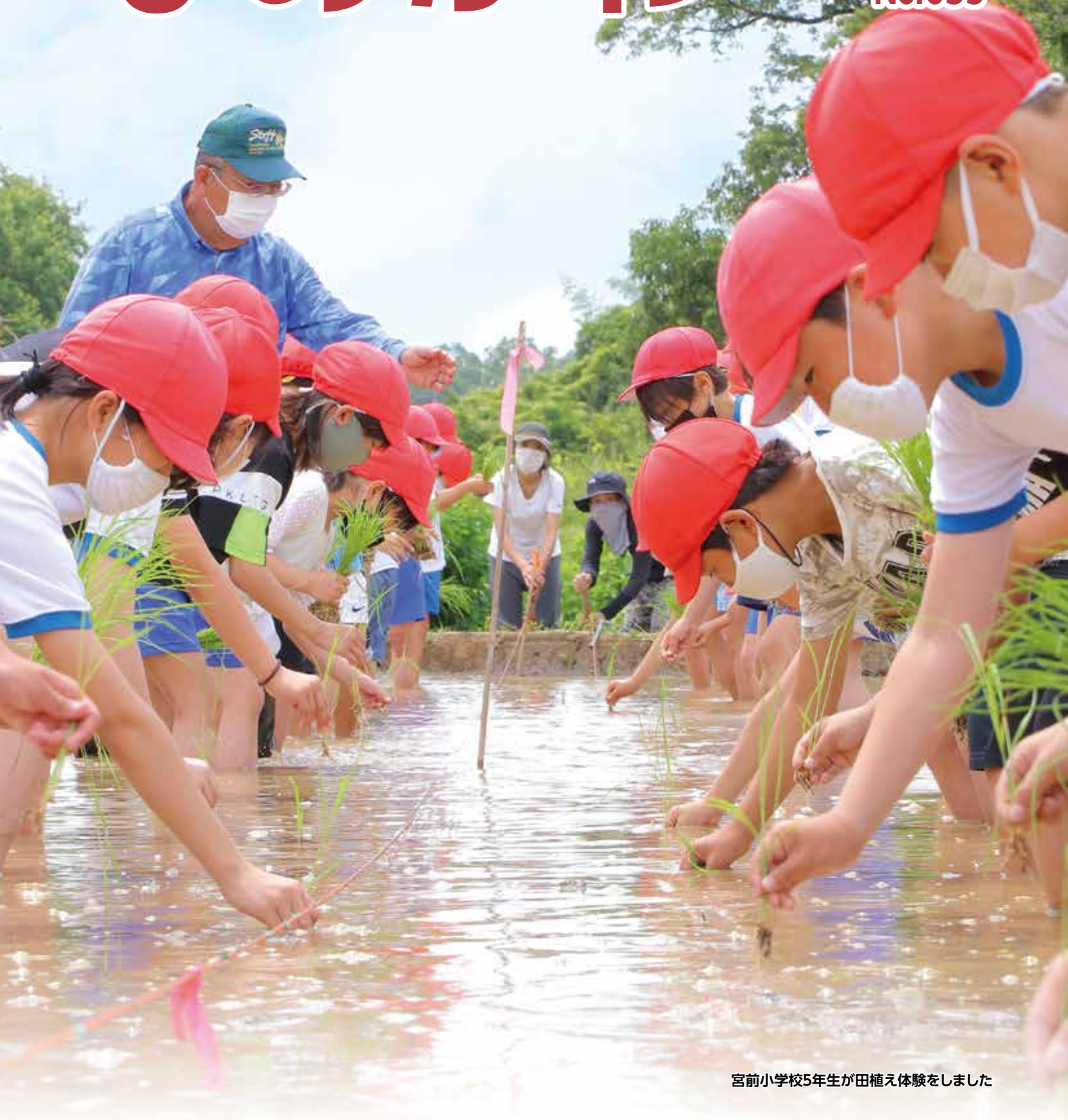
宮前小学校5年生が田植え体験をしました