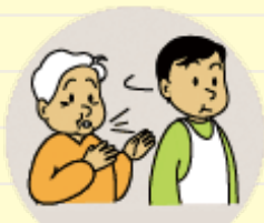
高齢者を叱りつける 無視する