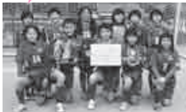
第36回鳩山大会 優勝