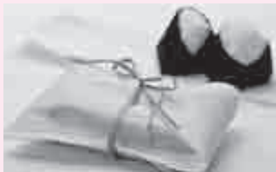
↑ 包装材として使われる枇木