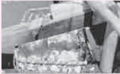
↑ 樫の木に刃をはめ込んだ道具を使い、削っていく。くるんと丸まった枇木を、昔はひざの上で広げ25枚に束ねた。

※附木（ツケギ）：薄い木片の端に硫黄を塗りつけたもので、火を他の物につけ移すのに用いた。マッチの原型。