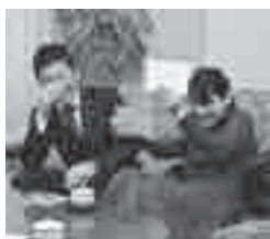
▲広報で撮影した婚活イベント時の写真を振り返り、思わず「恥ずかしい」と笑い合う2人。

れ、男女の出会いのチャンスを、行政がサポートするということが求められるようになってきました。