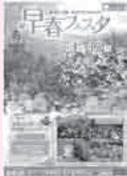
← 森林公園では4月2日（日）まで「早春フェスタ」を実施中

国営武蔵丘陵森林公園 所 滑川町山田1920 TEL 57-2111 URL http://www.shinrinkoen.jp/