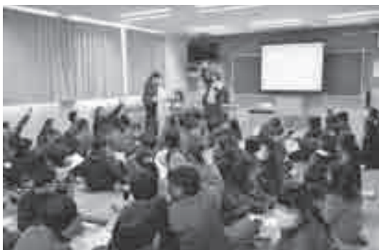
2月3日(金)、宮前小学校5年生を対象とした「認知症サポーター養成講座」を開講しました。高齢化が進む社会において、子どもたちも認知症を身近なこととして考え、学ぶことが、互いに支え合う地域づくりのきっかけとなります。講座ではクイズなどを交えながら、認知症についての理解を深めました。