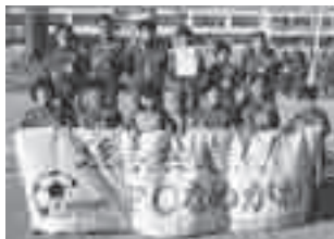
第9回FCなめがわ杯 準優勝

このほか、1月28日(土)に開催された「第12回日進レディースカップ」においても、準優勝を飾ることができました。