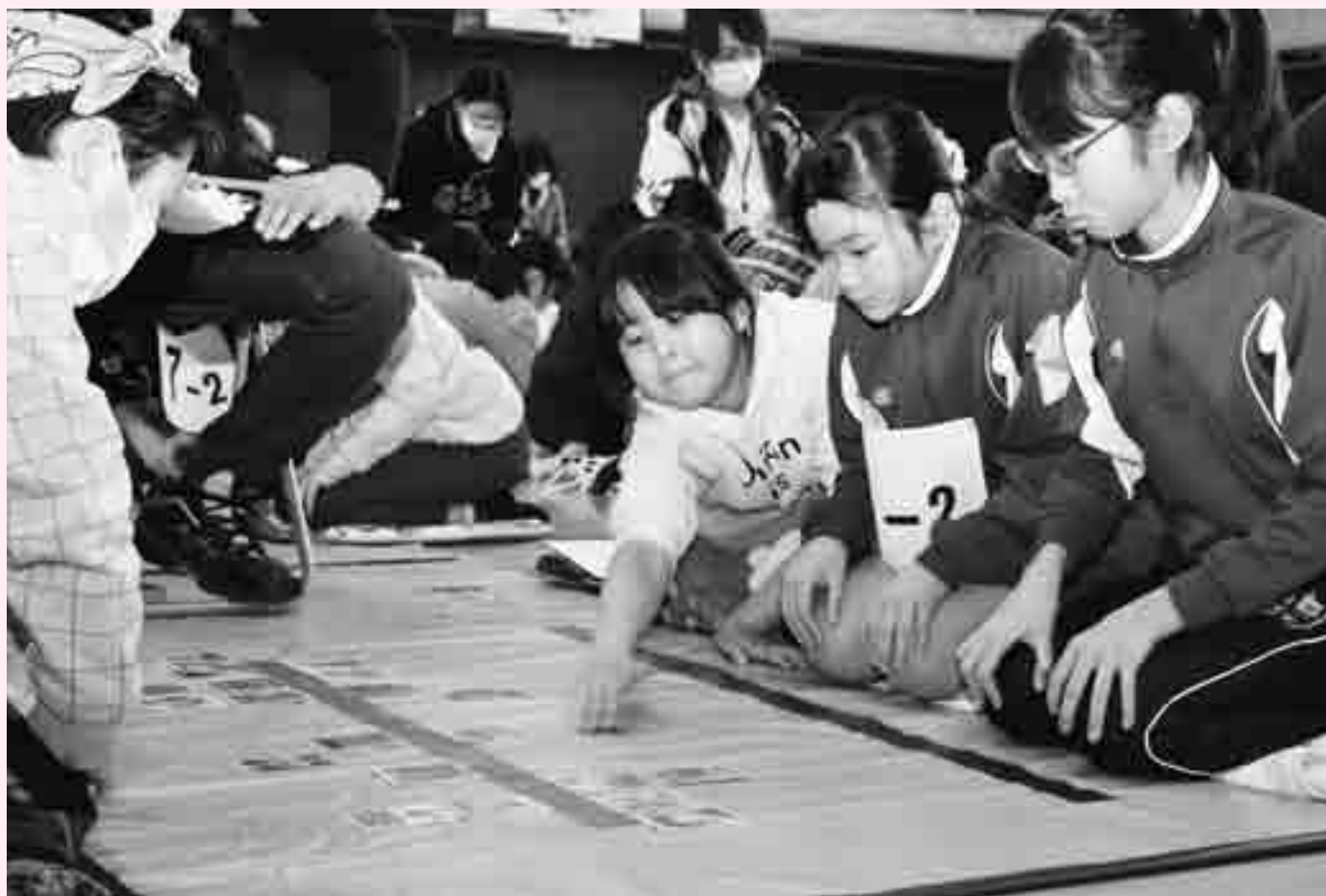
▲第22回なめがわ郷土かるた大会（1月21日(土)、総合体育館）