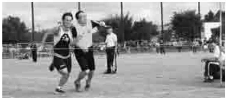
まさにデッドヒート！最終種目「年代別リレー」