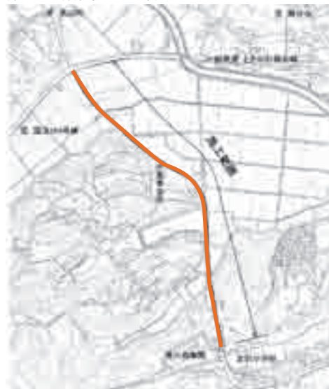
町道122号線(中尾地内)舗装修繕工事

工事期間中は大変ご迷惑をお掛けしますが、皆様のご理解とご協力をお願いいたします。