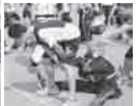
「ボール送りリレー」