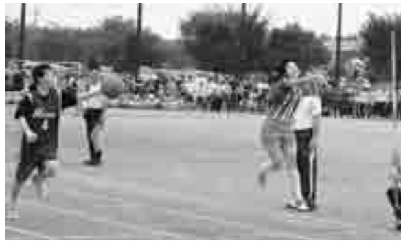
バトンはいろいろ「中学校部活対抗リレー」