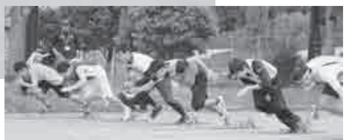
スタートの緊張が伝わります! 一般男子100m競走