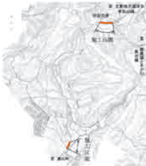
町道103号線(伊古地内)道路改良工事