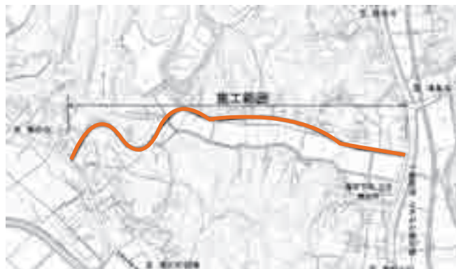
町道132号線(下福田地内)舗装修繕工事