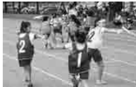
小学校親善リレー