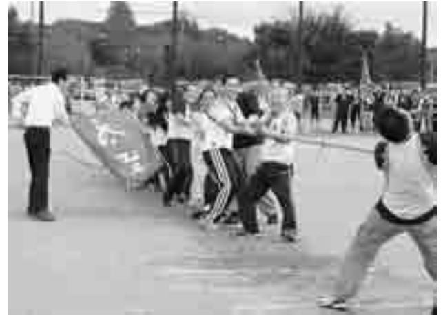
年齢不問男女各10名による「綱引き」