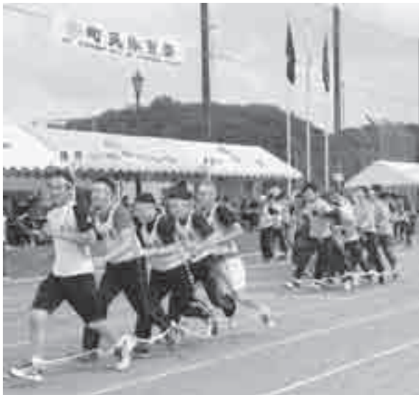
掛け声が大事!! 「むかで競走」