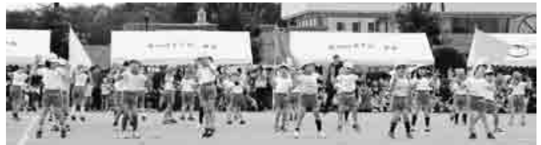
年長園児111名による体操「エビカニクス」かわい〜っ