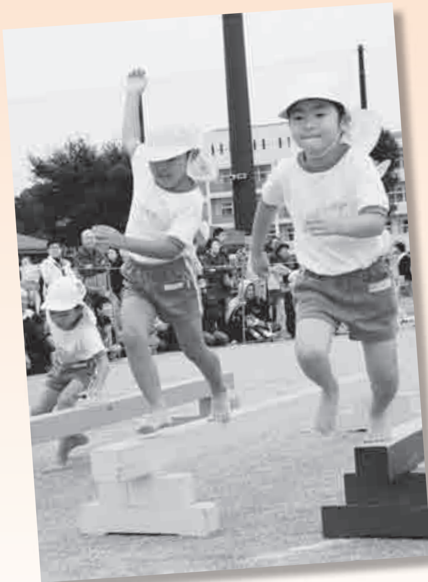
滑川幼稚園運動会 大迫力！年長児たちの障害物競争！！ (10月19日(土)、滑川町総合運動公園グラウンド)