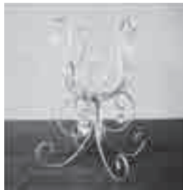
ワイヤークラフト

6月から10月まで開催したワイヤークラフト教室では、ワイヤを曲げたり絡めたり、ビーズを組み合せたりして、作品製作に取り組みました。同じ材料を使っても個々のセンスで仕上がりに違いが出て、それぞれのオリジナル作品に目を細めました。