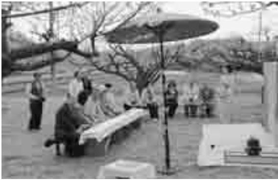
▲上山田地区の健康づくりグループが地元の梅畑で野点を開催。多くの方々交流を楽しみました。(3月10日(日))