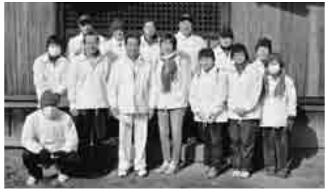
▲土塩地区で健康づくりグループ設立。地元神社で祈願してから活動を開始しました。(2月24日(日))