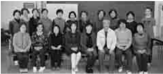
◀下福田地区で2つ目の健康づくりグループが設立。地元集会所を拠点に活動を開始しました。(3月6日(水) 下向・古姓集会所にて)