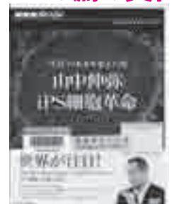
『“生命”の未来を変えた男 山中伸弥 iPS細胞革命』 DVD NHKエンタープライズ 出演: 山中伸弥・立花隆・国谷裕子

医療に革命をもたらす「iPS細胞」。それはいったい何なのか? 「iPS細胞」は私たちの未来をどう変えるのか? 生みの親である山中伸弥教授に立花隆(ジャーナリスト)・国谷裕子(キャスター)が徹底インタビュー。iPS細胞が拓く未来を見つめます。 図書館資料では、iPS細胞とその研究者である山中教授について書かれた「iPS細胞とはなにか」朝日新聞大阪本社科学医療グループ・著 講談社等が貸し出し可能です。