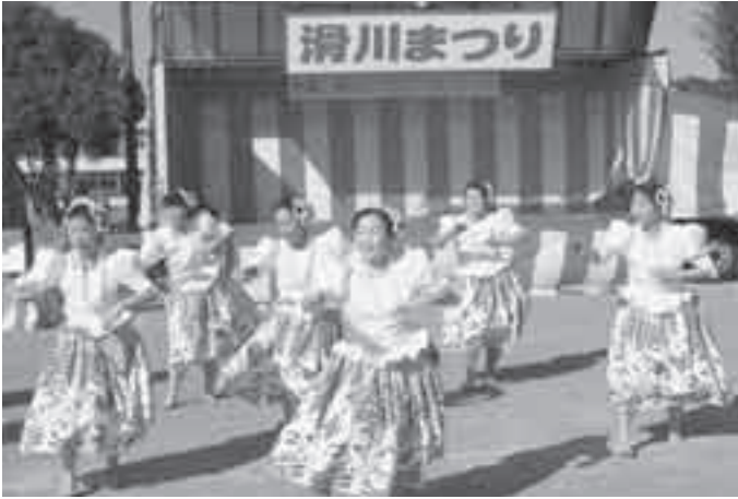
ココナツクラブによるフラダンス(メイン会場)