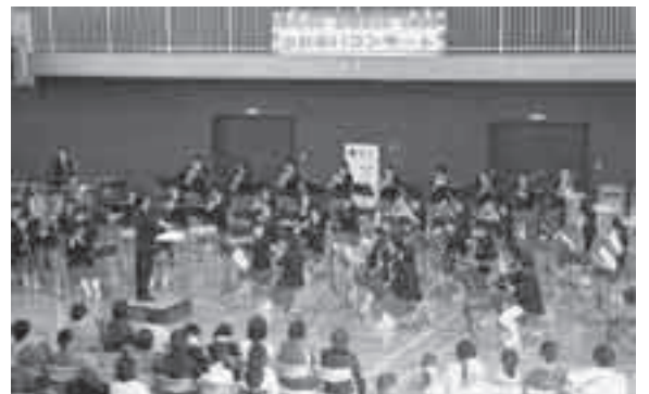
滑川中学校、滑川総合高校吹奏楽部による ふれあいコンサート (総合体育館)