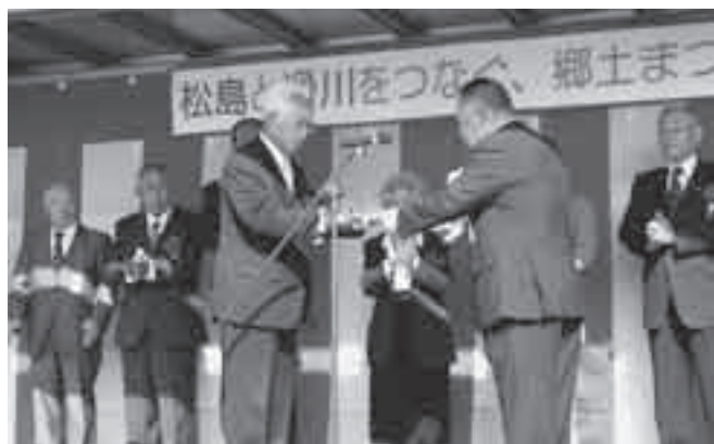
「滑川町表彰式」受賞者の皆さん (11月3日、滑川まつり会場)