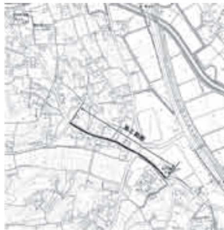
町道159号線舗装補修等工事 施工会社 有限会社小久保建材興業

工事期間中は大変ご迷惑をお掛けしますが、皆さまのご理解とご協力をお願いいたします。