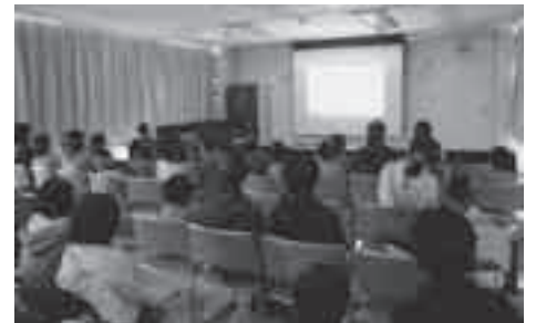
図書館まつりによる映画上映会(図書館)