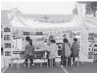
第24回健康フェスティバル (保健センター)