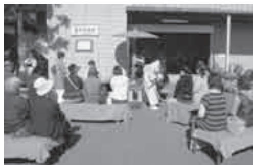
第34回滑川町文化祭による野点 (コミュニティセンター)

11月3日に「第32回滑川まつり」が開催されました。メイン会場の総合運動公園多目的グラウンドでは、アトラクション鑑賞やお買い物などを楽しむ大勢の方で賑わいました。