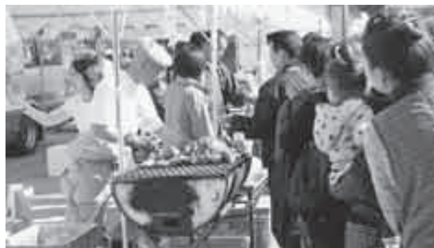
(大盛況の松島町特産品)

また、松島町は同日開催された滑川まつりに参加し、特産品の焼きかきなどを求めるお客さんによる長蛇の列ができていました。