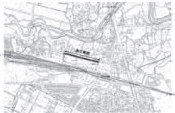
町道108号線舗装補修等工事 施工会社 株式会社中村組