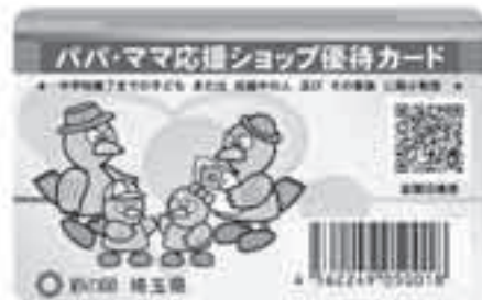
●埼玉県 パパ・ママ応援ショップ優待カード

これからは、「パパ・ママ応援ショップ優待カード」だけでなく、5県のカードもご愛用ください！