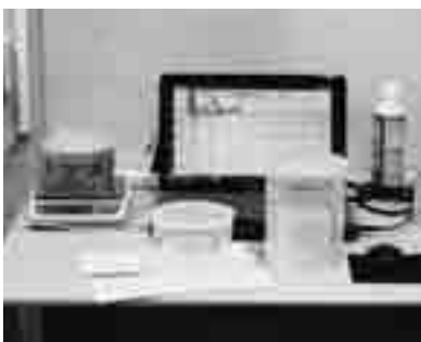
食品の放射能測定

測定器購入費 3,882,000円 学校給食センターでは、当日に納入された食材の中から3品程度と調理した1食分