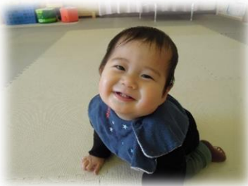
へびちゃん、癒されます😊