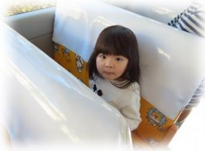
バスの中って楽しいな♪