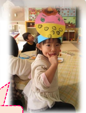
可愛い鬼のお面ができたよ(^)♪