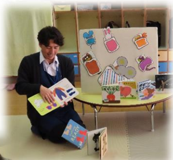
おすすめの絵本を紹介してもらいました☆