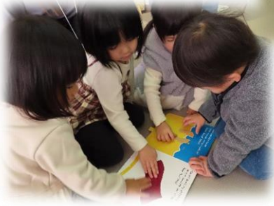
ふわふわ・ざらざらしている絵本があるね♪