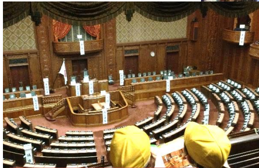
6年 社会赤見学 国会 科学技術館