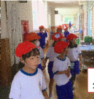
1年 学校探検 2年生をリーダーに