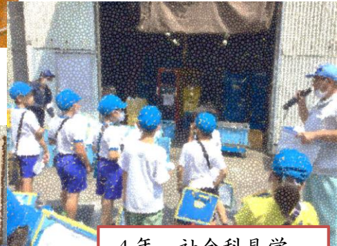
4年 社会科見学 小川町清掃組合