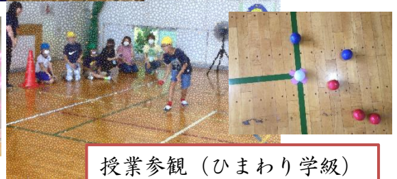
授業参観（ひまわり学級） ボッチャに挑戦