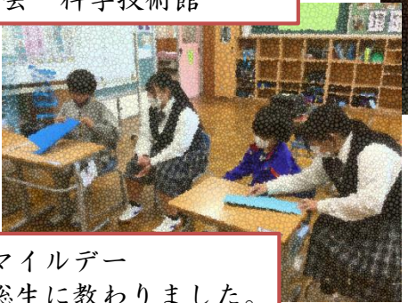
スマイルデー 滑総生に教わりました。