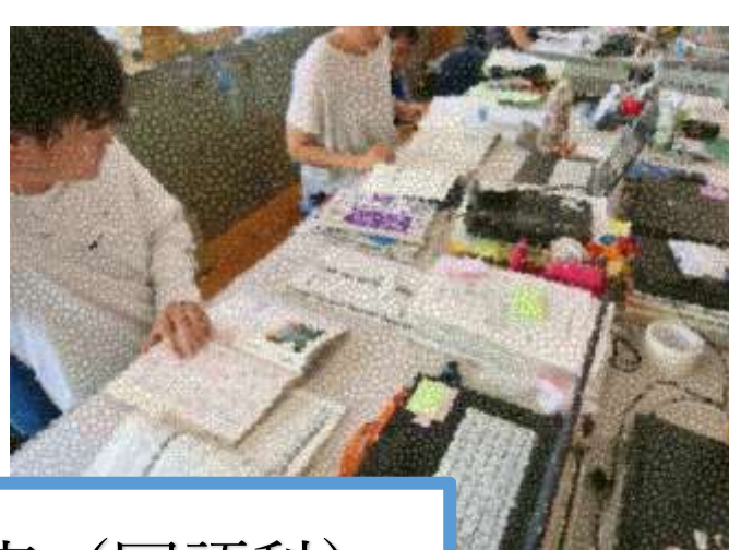
学校課題研究（国語科）