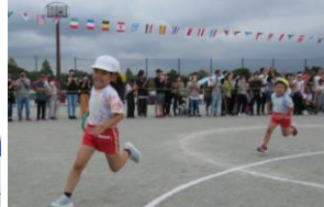
最終種目はリレー。仲間とバトンをつなぎ、最後まであきらめずに走りました。(年長)