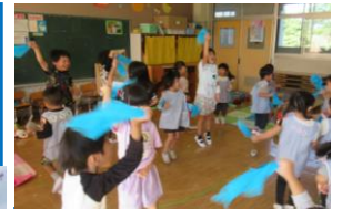
年少保育室で年長組の遊戯「まわせ！まわせ！」を踊る子供たち。