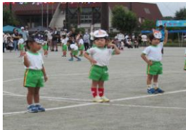
お気に入りのアンパンマンキャラクターのお面でお遊戯。(年少)

4年振りに人数制限なく実施することができた9月30日の運動会。御来賓の皆様を御招待し、観客席には大勢の保護者や祖父母の皆さん、懐かしい卒園児の顔もたくさん見えました。さらに今年はとても嬉しいことがありました。運動会当日に欠席した園児が一人もいなかったということです。全園児138名が元気に運動会に参加でき、頑張る姿を会場にいたみんなで応援できたことは本当に嬉しいことでした。運動会が終わった後も年少組が年中組のチェッコリ玉入れをして遊んだり、保育室を行き来して異年齢児と一緒に遊戯を踊ったりして楽しんでいます。運動会で経験した楽しさや達成感は子供たちの心に残り、子供たちの成長を支えていると感じています。