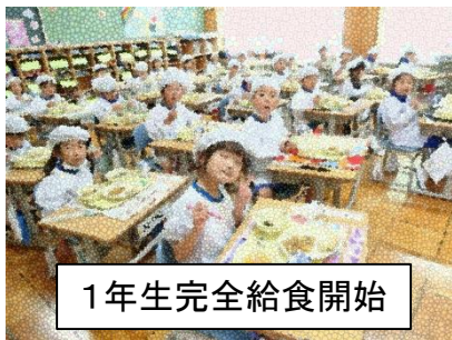
1年生完全給食開始