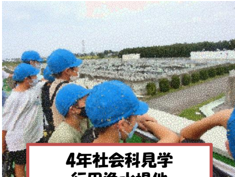
4年社会科見学 行田浄水場他