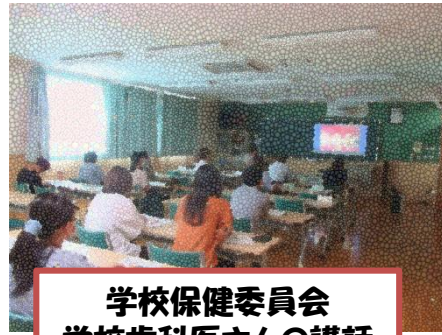
学校保健委員会 学校歯科医さんの講話