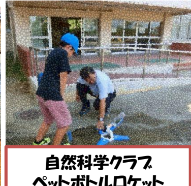
自然科学クラブ ペットボトルロケット