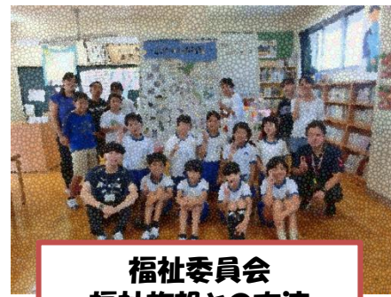
福祉委員会 福祉施設との交流