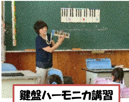
鍵盤ハーモニカ講習