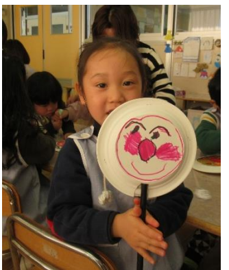
かわいいのができたよ♡