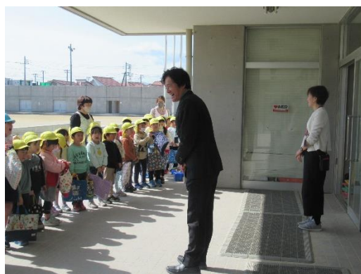
月の輪小学校の校長先生にも会えたよ！！