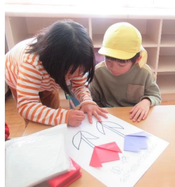
お兄さん、お姉さんと一緒に折り紙を折って制作をしたよ✍