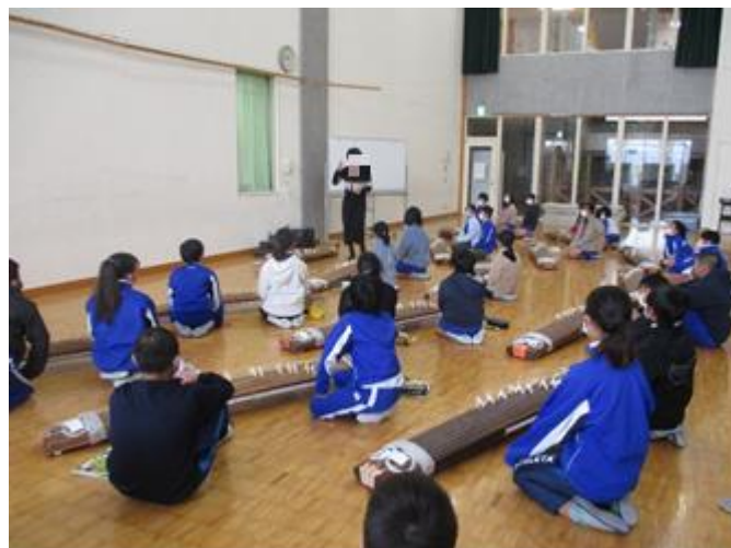
まずは、しっかりと話を聞きます