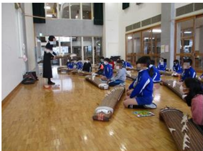
箏を前にしてちょっと緊張