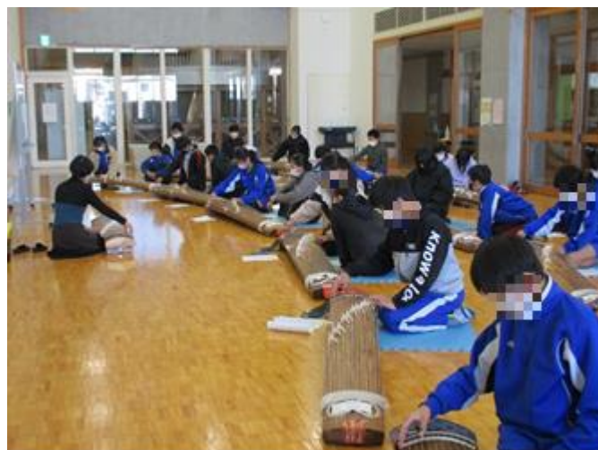
だんだん曲になってきました