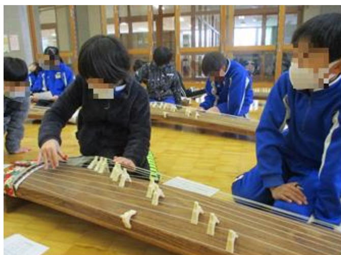
2人で1台を使います