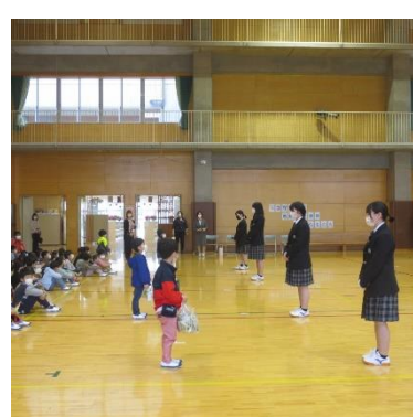
安全にカエル願いを込めて

1年生も入学して3週間が経ちました。「あいさつ・やさしい気持ち・しっかり話を聞く」をがんばって月の輪小学校の一員として、楽しい学校生活を送ってほしいです。