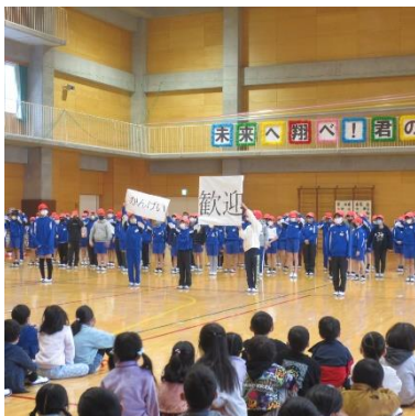
熱烈歓迎6年生の発表

4月15日（金）1年生を迎える会が行われました。体育館に集まった1年生に、各学年が順番に入れ替わりながら、ダンスや学年帽子を使って楽しく自学年の紹介をしたり、1年生へのメッセージを送ったりしてくれました。滑川総合高等学校生活部学校家庭クラブのみなさん4名も会に参加してくださり、1年生一人一人にフェルトで作成したマスコット「無事カエル」をプレゼントしてくださいました。学校や地域のみなさんが月の輪小学校の一員となった1年生を歓迎しました。