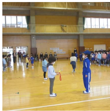
2年生からメダルのプレゼント