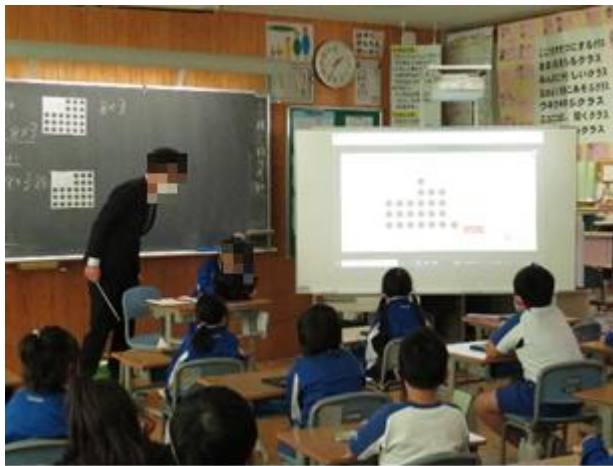
《黒板とスクリーンを使い分ける》