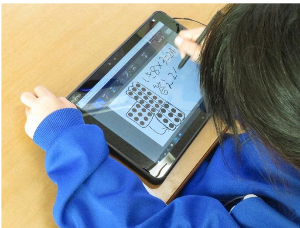
《タブレットで考え方を整理：2年生》