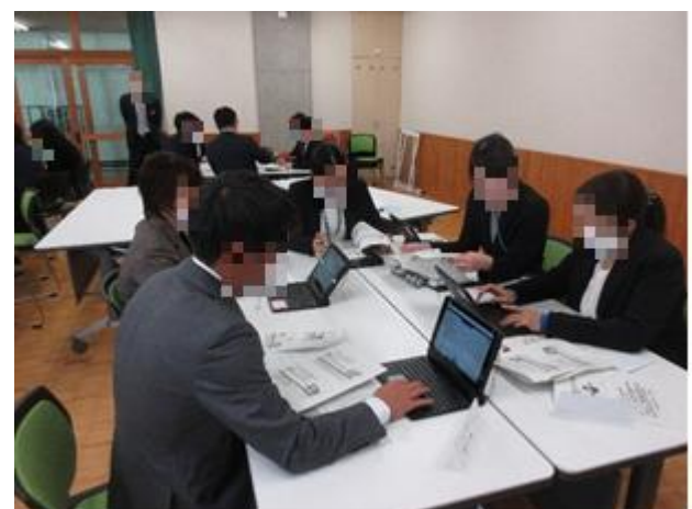
《研究協議会でもタブレットを使って》