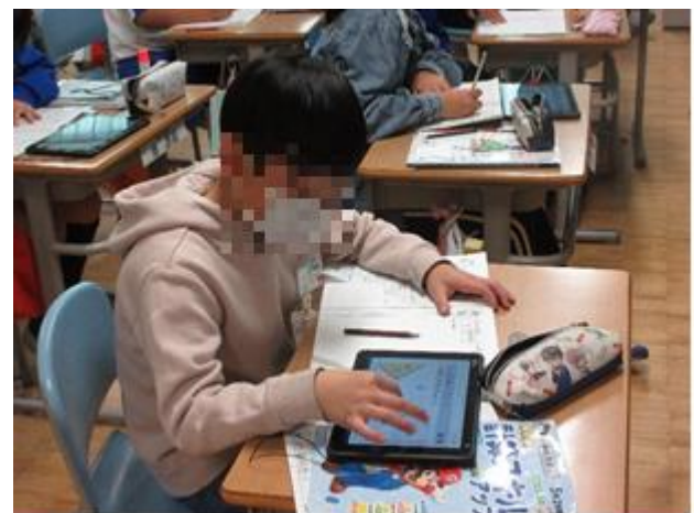
《5年生になると使い方も慣れてきました》