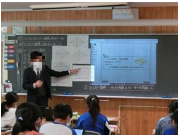
《それぞれの利点を生かして使い分ける》