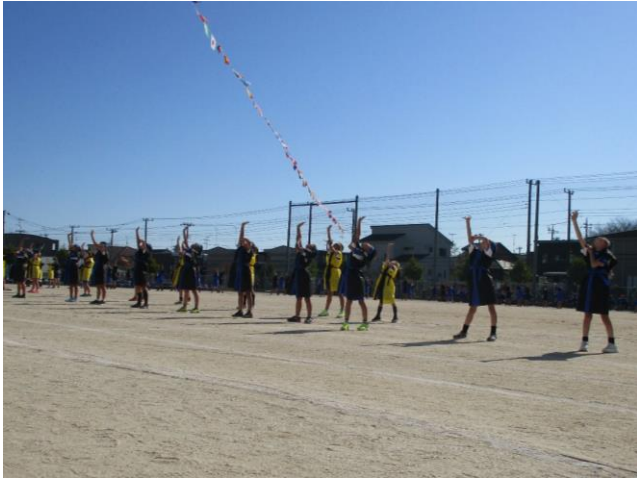
よさこいソーラン 「ヤッ！」決まった！