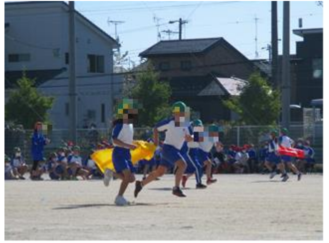
逃げ！ 大きなパンツが風でなびいています