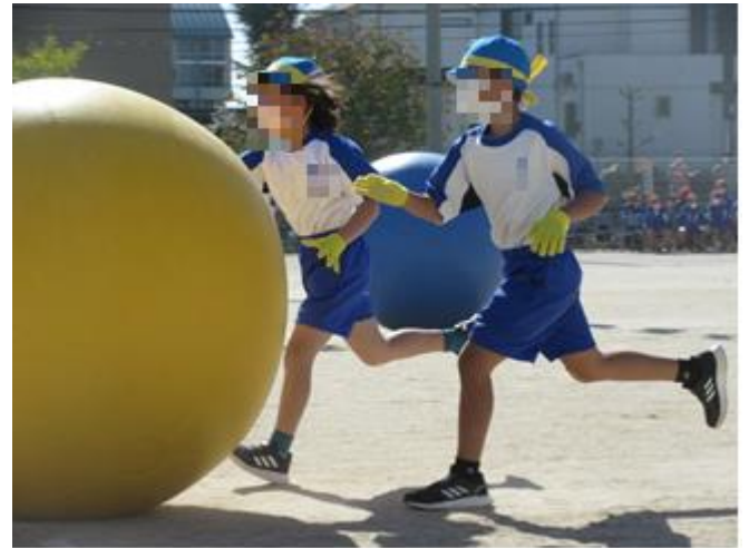
大玉に置いて行かれるな～!