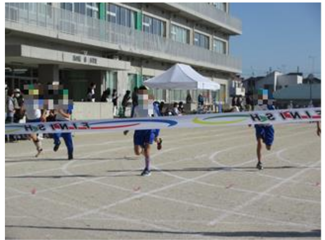
最後までがんばれ! Fight!