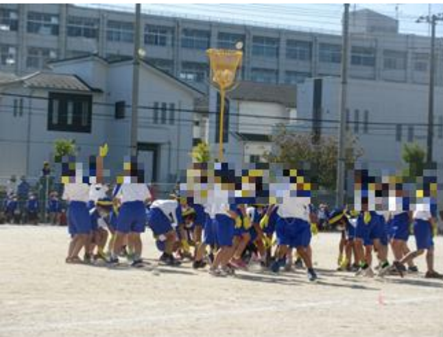
チェッコリー玉入れ かわいい～