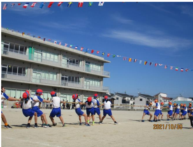
みんなで力を合わせて「せ～のっ！」