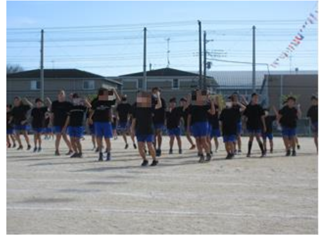
運動会のフィナーレを飾る、高学年のダンス「Unity」 かっこい～！！