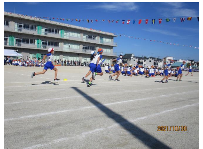
『ラスト頑張り！』 『次は任せた！』