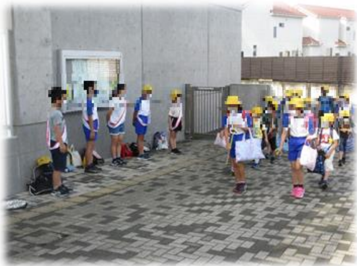
登校時の「あいさつ運動」

月小では、代表委員会が中心となり以前から毎週月曜日の登校時にあいさつ運動を行っていました。それに加えて「あいさつプロジェクト」を立ち上げました。各クラスで「あいさつリーダー」を募集して、毎週水曜日に朝グラウンドで遊んでいた児童が教室に戻るタイミングで大きく元気な声であいさつを交わしています。気持ちの良いあいさつが徐々に増えてきています。