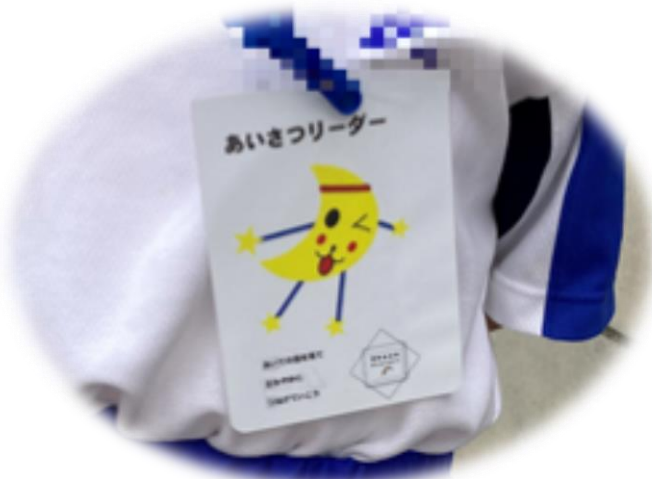
「あいさつリーダー」のワッペン