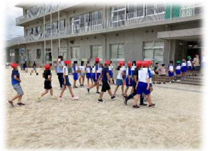
教室に戻る児童へ元気なあいさつをおくる「あいさつリーダー」