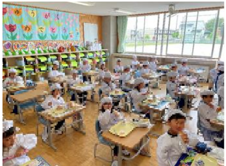
簡単給食ですが、おいしい! 笑顔がこぼれます