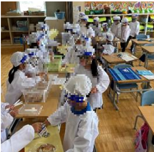
初めての給食当番 頑張ってます!