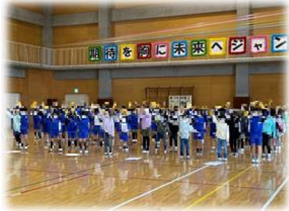
学年帽子を振ってアピール！