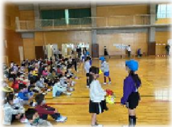
プレゼントをもらって嬉しそう