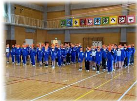
さすが6年生 ビシッと整列！