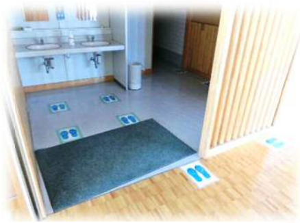
トイレ、流し等では、距離をあけて並びます。しっかり手洗いをし、アルコール消毒もします。