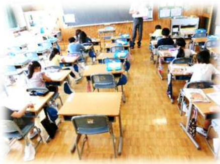
分散登校時には、席を離して勉強していました。現在でも、可能な限り机を離しています。