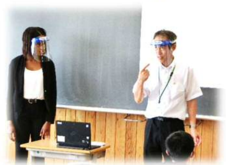
授業での会話や話し合いの場面、給食の配膳等では、教師も児童もフェイスシールドを付けて行います。