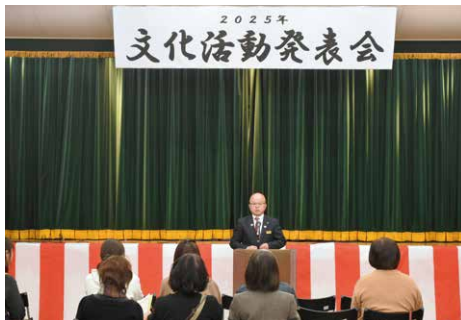
3月1日 文化活動発表会