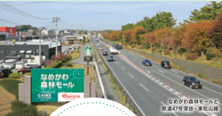
なめがわ森林モールと 県道47号深谷・東松山線