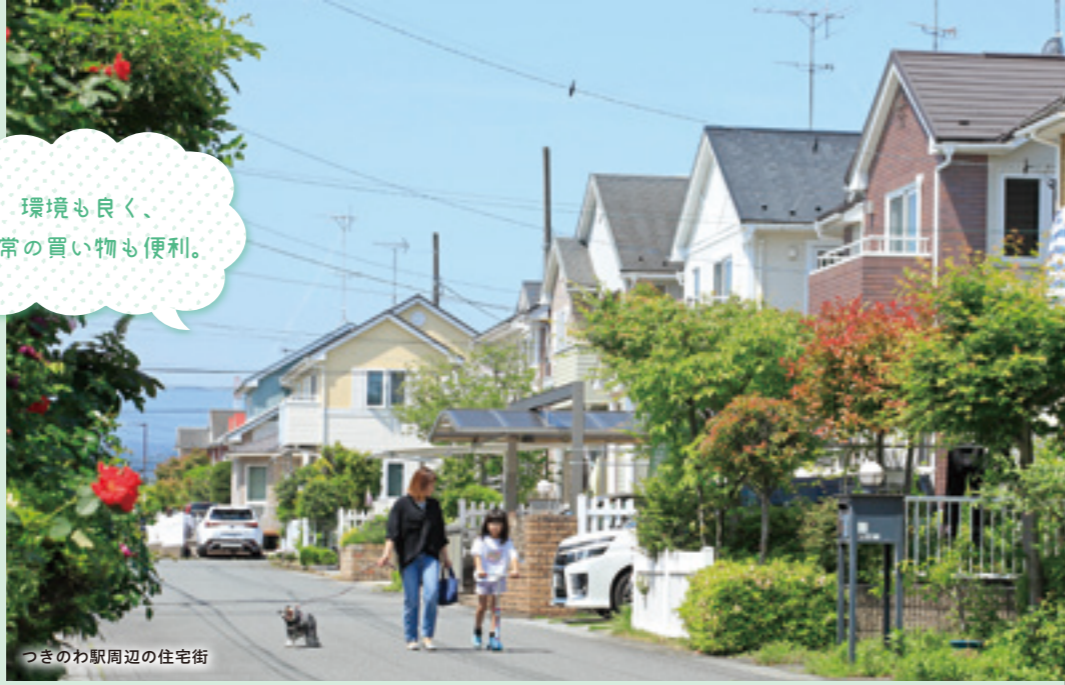
つきのわ駅周辺の住宅街