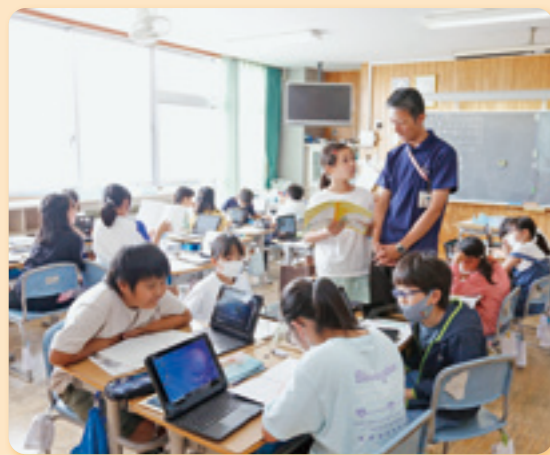
小学校の調べ学習

自然と触れ合える子育て環境 町の北部には広大な国営武蔵丘陵森林公園や緑豊かな田園が広がり、四季折々の豊かな自然と触れあえる子育て環境も大きな魅力となっています。また、小学校では、貴重な国の天然記念物ミヤコタナゴの飼育を通して、自然環境を守ることの大切さも学びます。 さらに、食育にも力が入られ、谷津田米は通年で食べることができ、滑川産食材でつくる地産地消の給食を提供する日も設けられています。 心にゆとりを持って子育てできる滑川町の環境は、まさに「子育てナンバーワンの町」にふさわしいものです。