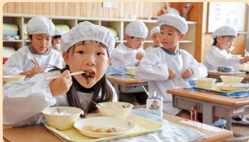
谷津田米を使用した地産地消の給食

Namegawa Town has some of the highest population growth rates and birth rates in Japan, and is especially preferred by families raising children. The primary reason is that we strive to provide generous childcare support. Namegawa Town is one of the first municipalities in Japan that provide free medical care for children and free school meals. We also offer community childcare support centers and after-school care centers. In the last few years, we have begun distributing childcare assistance payments starting from the first child and operating school buses for children commuting long distances. Namegawa Town is also highly regarded for its environment where residents can interact with the rich nature of the four seasons and for its emphasis on food education, such as our special school lunches made with Yatsuda (rice paddies located in the valleys of low-lying hilly areas called yatsu) rice.