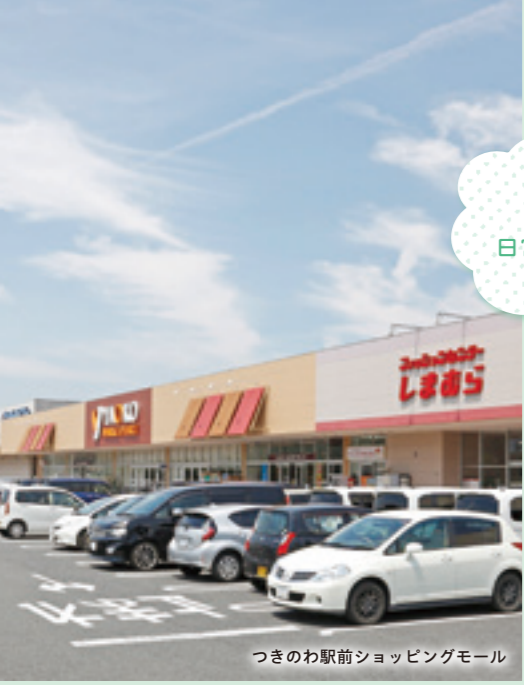
つきのわ駅前ショッピングモール